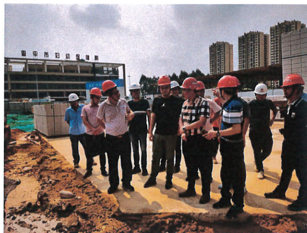
恩平市住建局检查“锦江帝景花园项目”

恩平市住房和城乡建设局对“锦江帝景花园项目”项目开展“两场联动”检查。检查发现：1. 施工现场部分裸露黄土未覆盖；2. 运输车辆未经冲洗干净带泥上路，污染市政道路；3. 施工现场道路未硬底化。目前，检查发现的问题已经落实整改。