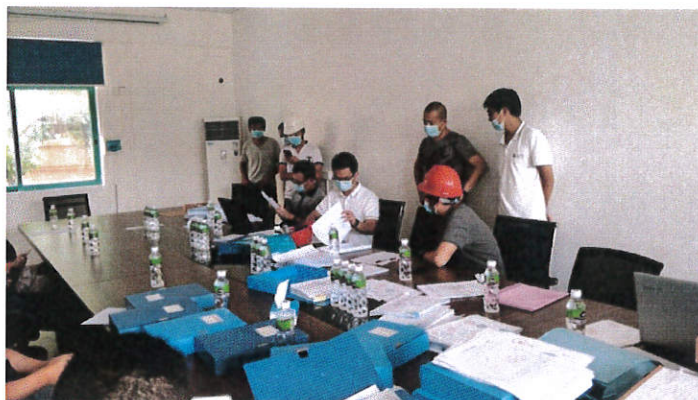
蓬江区住建局检查“炮台南路(白石桥-东炮台桥)段道路及边坡维修工程”等四个项目

腾路~滨江大道)工程”四个项目开展“两场联动”检查。检查发现部分项目存在以下问题：1. 检查时部分投标承诺派驻项目管理人员不在岗；2. 部分施工档案资料存在代签现象；3. 人员变更手续不完善。目前，检查发现的问题已经落实整改。