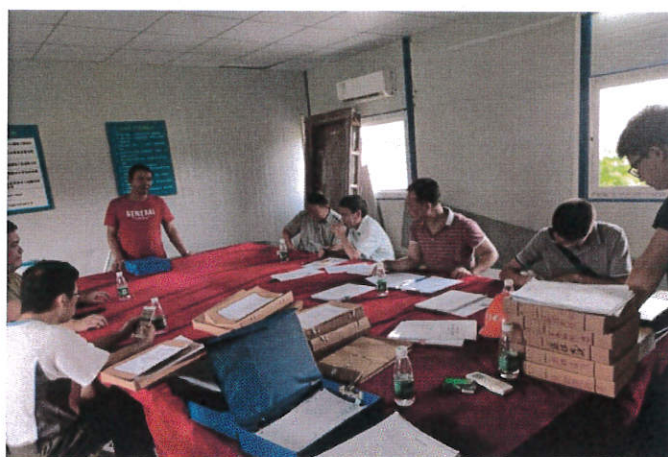
新会区住建局检查“消防服务中心建设工程项目”

新会区住房城乡建设局对“消防服务中心建设工程项目”项目开展“两场联动”检查。检查发现施工现场工程文件资料收集不完整。目前，检查发现的问题已经落实整改。