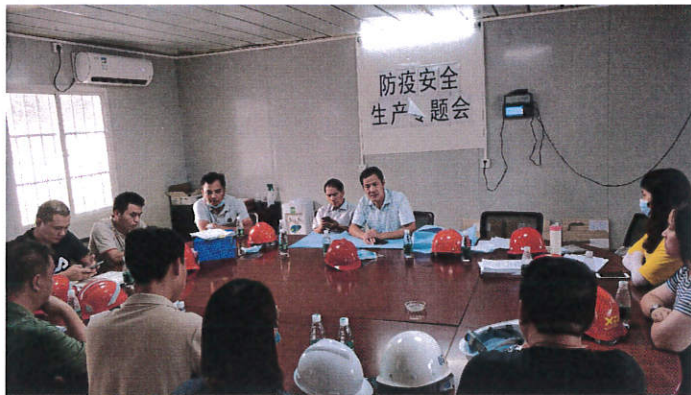
江门市住建局检查“江门市图书馆改扩建项目”

设踢脚板，未挂防护网；6. 通道口顶部防护不严；7. 临电电线直接固定在外脚手架且未做防护；8. 个别施工平台搭设稳定性差；9. 公司安全检查记录中参与检查人员不符合要求；10. 围墙边堆土过高存在滑塌隐患。目前，检查发现的问题已经落实整改。