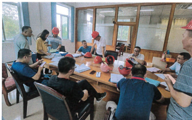
鹤山市住建局检查广东富成联合金属制品有限公司“车间一、车间二、车间三项目”等两个项目

公司厂房项目”和“广东富成联合金属制品有限公司车间一、车间二、车间三项目”开展“两场联动”检查。现场资料基本完善，检查未发现问题。