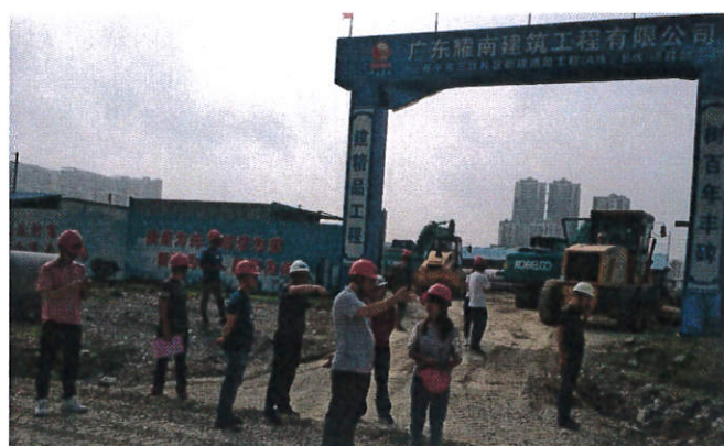
开平市住建局检查“开平市三江片区道路 A、B 线”项目

开平市住房和城乡建设局对“开平市三江片区道路 A、B 线”项目开展“两场联动”检查。检查未发现问题。