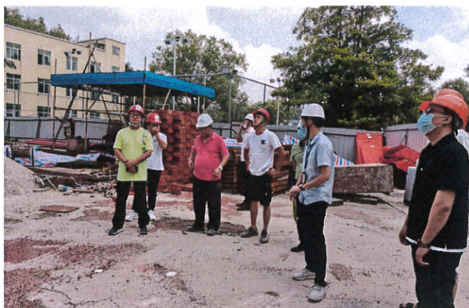
台山市住建局检查“江门市病残吸毒人员收治所”项目

（定人员、定时间、定措施）整改要求；4. 监理单位对工程存在的质量或安全隐患发出的整改通知书未能跟踪督促施工单位落实